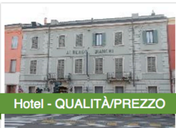
Hotel - QUALITÀ/PREZZO